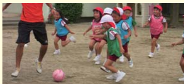
サッカー活動 年中児・年長児 年5回