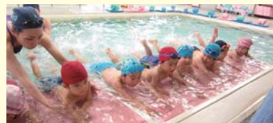
スイミング 年中児・年長児 毎月2回