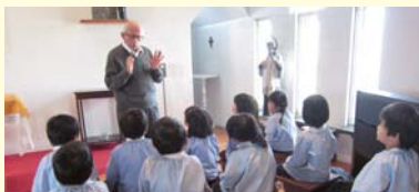
こころのおはなし 全園児 毎週1回