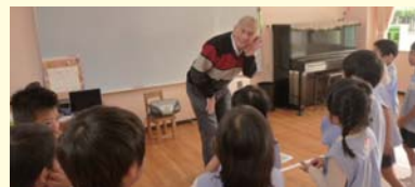
英語活動 全園児 毎月3回