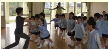
リトミック活動 全園児 毎月1回